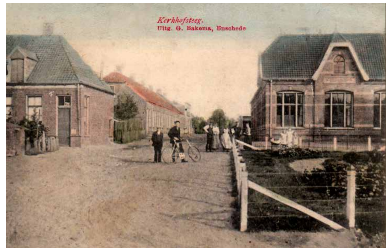
Hoek Deurningerstraat en Dr. Benthemstraat (Kerkhofsteeg).