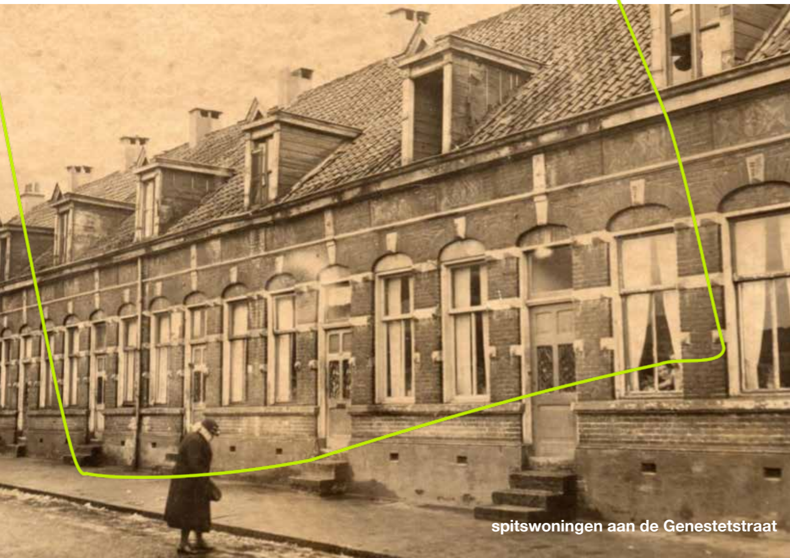
spitswoningen aan de Genestetstraat