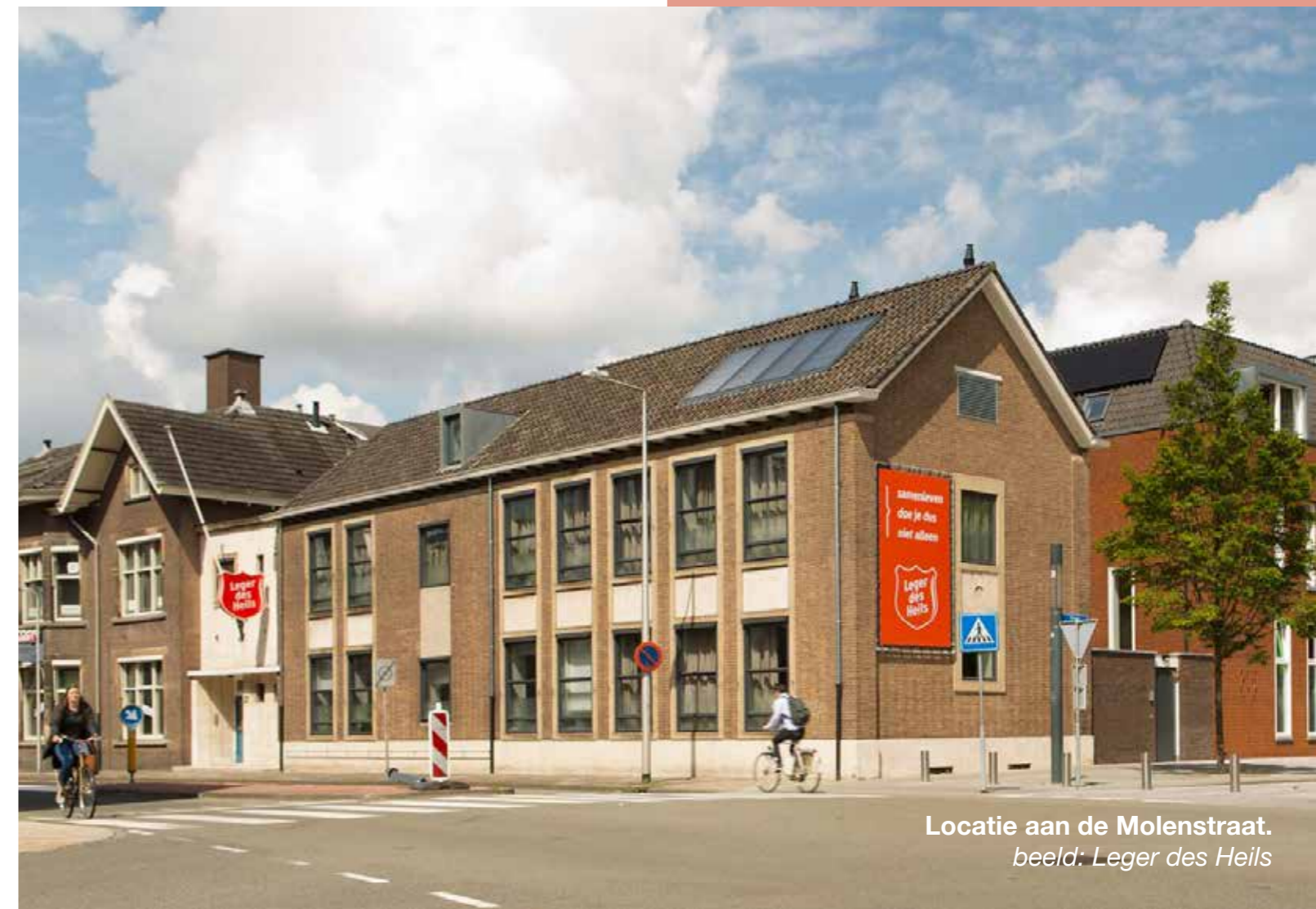
Locatie aan de Molenstraat.

scan de QR-code om het filmpje te bekijken