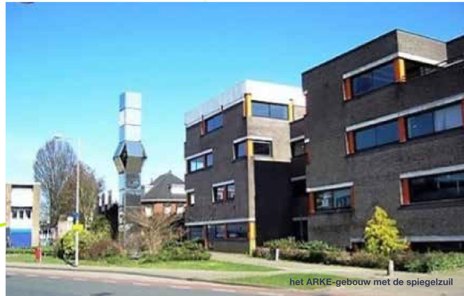
het ARKE-gebouw met de spiegelzuil

De lijst met inmiddels verdwenen bedrijven is nog oneindig lang en te veel om op te sommen. Toch wil ik nog één noemen, namelijk reisbureau ARKE aan de Deurningerstraat. In dit gebouw was het hoofdkantoor gevestigd met kantoren en het reisbureau. Er was een grote onderdoorgang waar de touringcars door konden rijden om op een binnenplaats uit te komen. Hier werden de bussen onderhouden en konden ze ook gestald worden. Aan de straatkant was een klein grasperkje met daarin een grote spiegelzuil. Op zo'n 5 meter van de grond kon een deel van deze zuil open/dicht bewegen. Dit symboliseerde de dynamiek van het Twentse bedrijfsleven. Het mechanisme dat voor de beweging moest zorgen was vaker kapot dan dat het werkte zodat dit al gauw weer buiten werking werd gesteld. Toen ARKE in 2015 onderdeel werd van TUI werd de vestiging aan de Deurningerstraat gesloten.